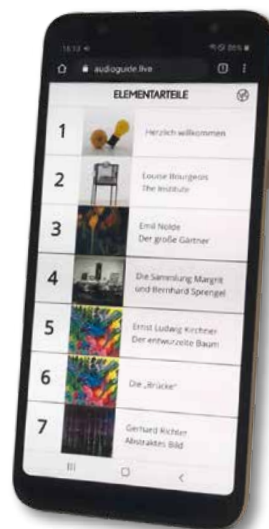
Smartphones Ihrer Besucher*innen